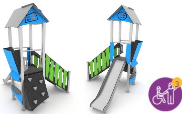
ALTALENA A CESTONE INCLUSIVA

CASTELLO A TORRETTA INCLUSIVA CON SCIVOLO, ARRAMPICATA E GIOCO DI RUOLO