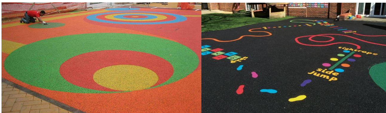
Esempio di pavimentazione in gomma colata